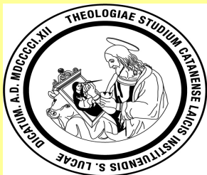
I.S.S.R. “San Luca”