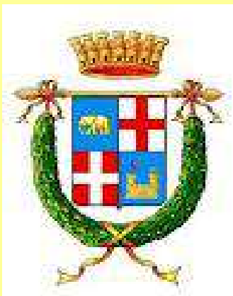
Provincia Regionale di Catania