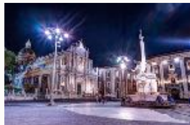
Italia - Catania