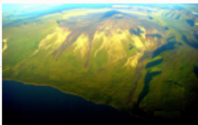
Ile de la Réunion